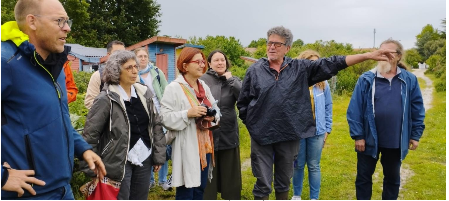
Ο ΑΣΤΟ-Επικοινωνούμε στη Γαλλία 2024