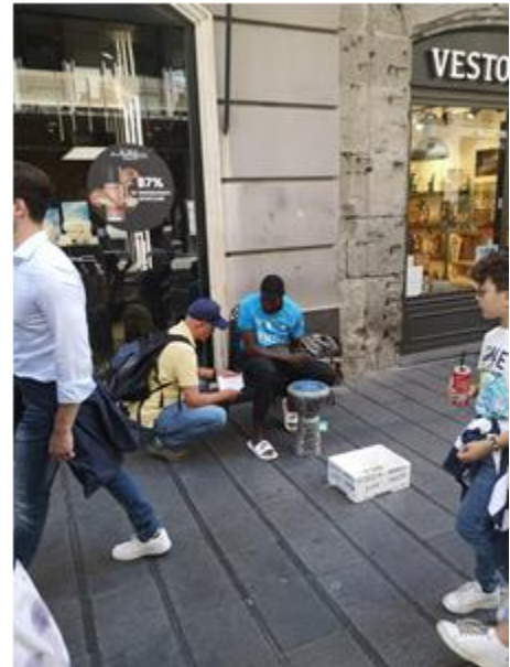
Δράση ευαισθητοποίησης για την 1η Μαΐου στην Ιταλία