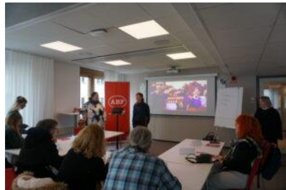
Η ABF παρουσιάζει διαδραστικές μεθόδους λαϊκής εκπαίδευσης