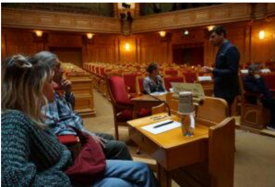
Επίσκεψη στο κοινοβούλιο της Σουηδίας στη Στοκχόλμη