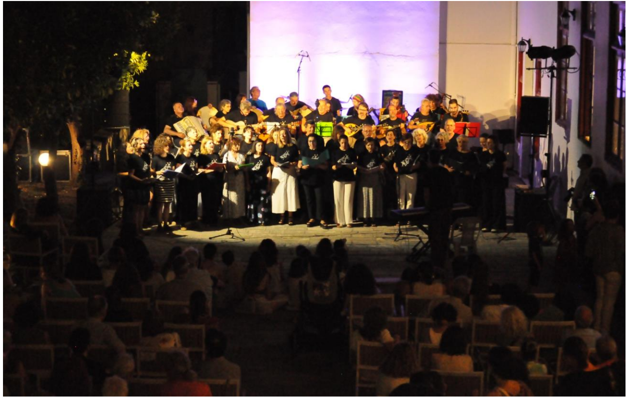
Φεστιβάλ ΑΣΤΟ-Επικοινωνούμε 2023 | Παλιό Δημοτικό Νοσοκομείο Πατρών