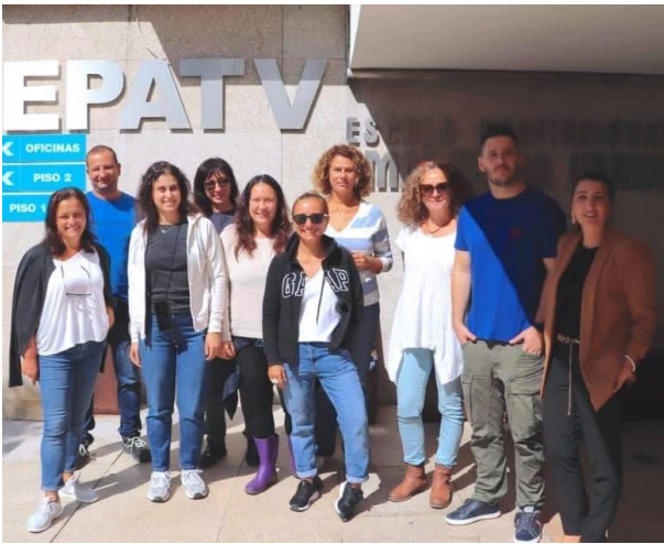
Η υποδοχή στο EPATV ήταν πολύ θερμή