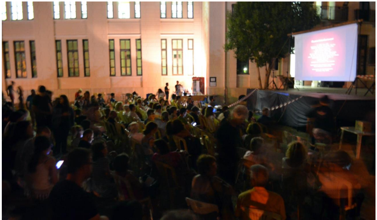
Διεθνές Φεστιβάλ Ταινιών Μικρού Μήκους ΑΣΤΟ-Επικοινωνούμε 2019 | Σκαγιοπούλειο Ίδρυμα Πατρών