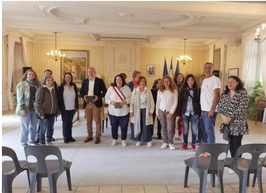
Επίσκεψη στο δημαρχείο της Saintes της Γαλλίας