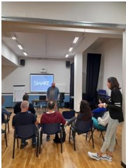
Εργαστήριο για την πολιτιστική κληρονομιά και την αστική αναβάθμιση