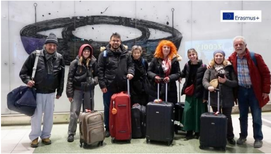
Άφιξη της ομάδας Σουηδίας στη Στοκχόλμη