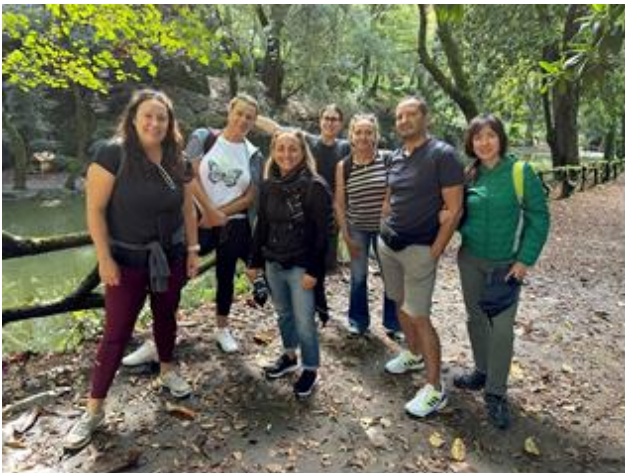
Πεζοπορία στο Peneda-Geres National Park

Η συνεργασία με το EPATV έδωσε στην ομάδα Πορτογαλίας εφόδια ως προς την οργάνωση εκπαίδευσης ενηλίκων και τη διαχείριση διαφωνιών, ως προς την αξιοποίηση της πολιτιστικής κληρονομιάς προς όφελος του τόπου και των ανέργων (κυρίως γυναικών).