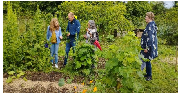
Κοινωνικοί κήποι – φυσική καλλιέργεια

Η ομάδα Γαλλίας του ΑΣΤΟ-Επικοινωνούμε εκπαιδεύτηκε από το Centre Social Belle Rive της πόλης Saintes πάνω σε θέματα περιβαλλοντικά και την αειφόρο ανάπτυξη (οργάνωση κοινωνικών κήπων, μελισσοκομία), πολιτιστικά (διοργάνωση πολιτιστικών δράσεων και εκπαιδευτικών πρακτικών), κοινωνικό-οικονομικά (δημοκρατίας, ισότιμης συμμετοχής πολιτών, παραγωγής τοπικών προϊόντων). Με τη συζήτηση με το Δήμαρχο και δύο δημοτικούς συμβούλους ενημερώθηκε για τους διαφορετικούς τρόπους αντιμετώπισης των προβλημάτων των δημοτών.