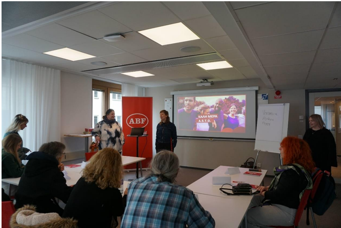
Ο ΑΣΤΟ-Επικοινωνούμε στη Σουηδία 2024