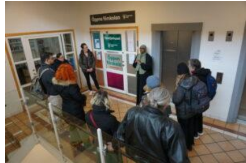
Στο Folkets Hus Rinkeby, κέντρο για περιθωριοποιημένες κοινότητες