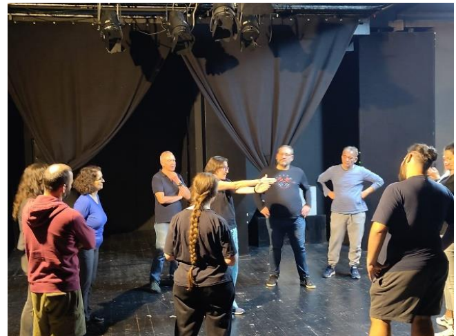
Εργαστήριο θεάτρου από το Teatro Civico 14

Η ομάδα Ιταλίας, στην επαφή της με τον Ιταλικό φορέα εκπαιδεύτηκε πάνω σε θέματα όπως: αντιμετώπιση του αναλφαριθμητισμού και κοινωνική ένταξη ανθρώπων με λιγότερες ευκαιρίες, προσαρμογή σε νέα περιβάλλοντα και ανάπτυξη ομαδικού πνεύματος, ευαισθητοποίηση του πολίτη για την κατανόηση της κοινωνικό-οικονομικής, πολιτικής και νομικής πραγματικότητας, κατανόηση, επικοινωνία και έκφραση μεταξύ διαφορετικών πολιτισμικών ομάδων και σημασία της αλληλεπίδρασης με μεταναστευτικές και προσφυγικές ομάδες