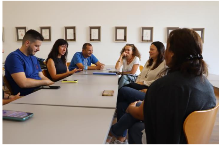
Workshop Για τις πολιτισμικές ομοιότητες και διαφορές των χωρών υποδοχής και αποστολής